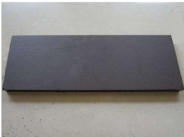
Vorder- und Rückansicht

WPC Premium-Terrassendiele Massiv, 20 x 140 mm, glatt / fein